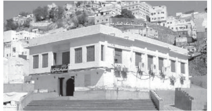
Peygamber Efendimiz'in doğduğu ev!

Cahiliyyet devrinde dünyanın hali perişandı. Peygamberler tarafından tamir ve ıslah, insanlar tarafından tahrib ve ifsad devam ediyor; gele gele bu hal Hz. İsa (a.s.)'a kadar geliyor. İsa Peygamber'in ıslah ettiği, düzelttiği din, hak din, Hz. Adem'le başlayan din, kendinden sonra, bilhassa yahudiler tarafından çığırından çıkarılmaya, altüst edilmeye maruz kalıyor. Bu durum, 600 sene gibi bir zaman içinde devam ede ede öyle bir hale geliyor ki, Hz. İsa'nın öğrettiği din